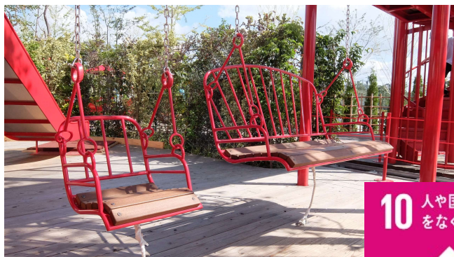
障害を持つ子供たちも一緒に遊べる「インクルーシブ公園」