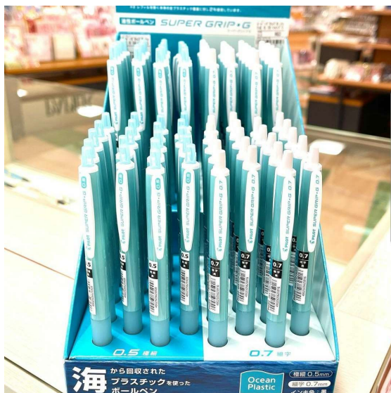
海に捨てられたプラスチックを使ったボールペン